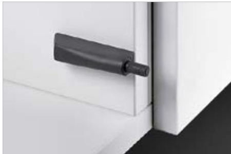
Push to open Magnet