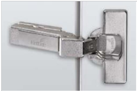
Intermat W20 Winkelscharnier

Intermat 9936 W20 For 20° face angle applications