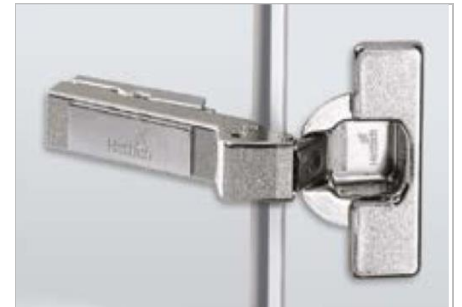
Intermat W30 Winkelscharnier

Intermat 9936 W45 For 45° face angle applications