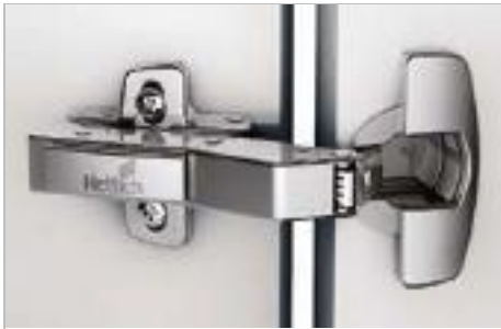
Sensys W30 Winkelscharnier