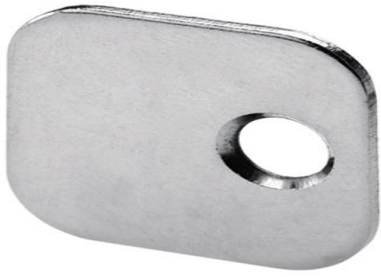
Gegenplatte zum Ankleben und Anschrauben