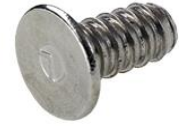
Gegenplatte zum Einpressen