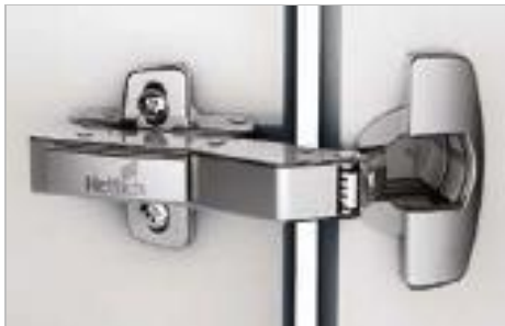
Sensys W30 inkelscharnier

Sensys 8639i W30 Für Winkelanschläge 30°