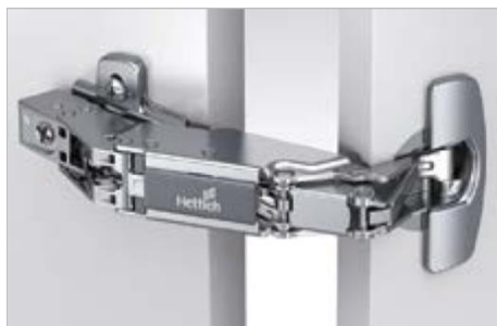
Sensys 165° Null-Einsprungscharnier

Sensys 8657i Für ungehinderten Zugriff auf den Stauraum