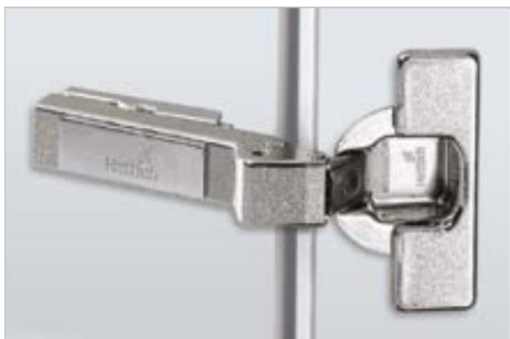
Intermat W30 Winkelscharnier

Intermat 9936 W30 For 30° face angle applications