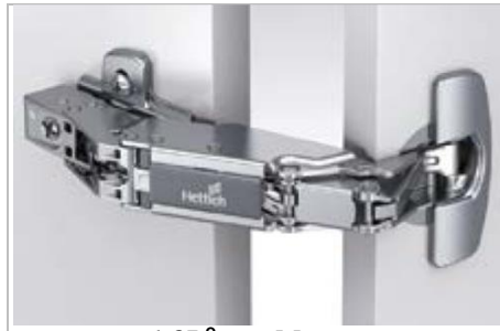
Sensys 165° Null- Einsprungscharnier

Sensys 8687 Für ungehinderten Zugriff auf den Stauraum