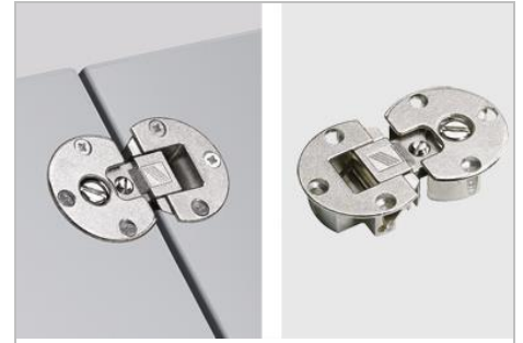
Klappenscharnier Markant 11 Für vorliegende Klappen