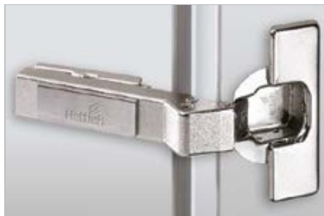
Intermat W45 Winkelscharnier

Intermat 9966 W30 For 30° face angle applications