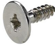
Gegenplatte zum Anschrauben