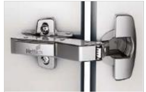
Sensys W45 Winkelscharnier

Sensys 8687 Für ungehinderten Zugriff auf den Stauraum