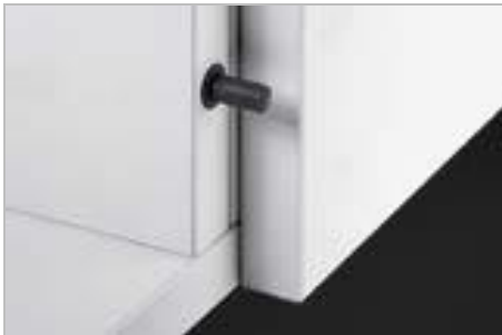
Push to open Pin strong