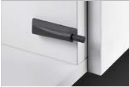
Push to Open Pin