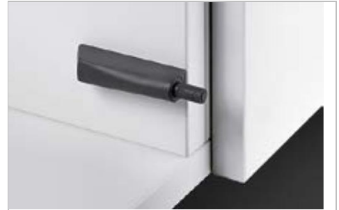
Push to open Pin strong