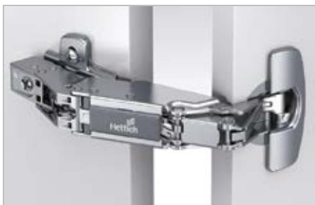
Sensys 165° Null-Einsprungscharnier

Sensys 8657i Für ungehinderten Zugriff auf den Stauraum