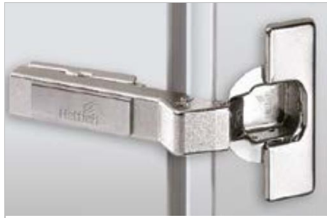
Intermat W45 Winkelscharnier

Intermat 9936 W20 For 20° face angle applications